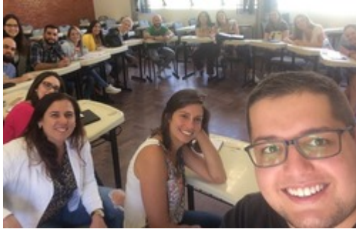
Mestrandos e doutorandos em Psicologia da Unisinos, parte do grupo de trabalho que recebeu a denominação de "SBP do Futuro".