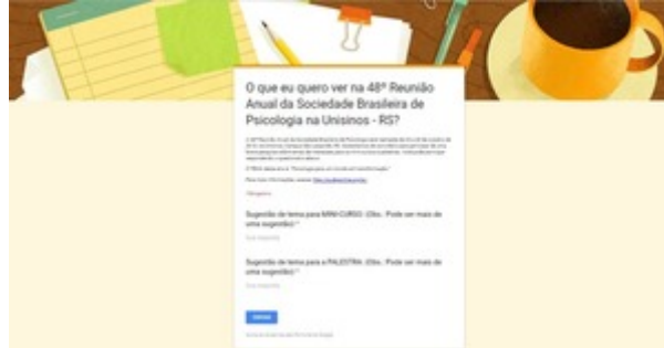
Pesquisa de sugestões para a 48ª RA da SBP.